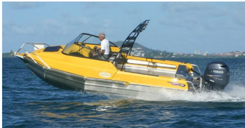
Stabi-Craft Fisher 6m avec options: peinture et portique

Rapide, solide et légère, cette coque semble beaucoup plus grande dans les vagues. Choisissez le pack d'options idéal pour la pêche, le sport nautique ou les balades en famille. Un bateau de grande qualité qui donne confiance dans toutes les conditions.